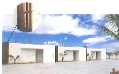
沖縄県リゾートホテル